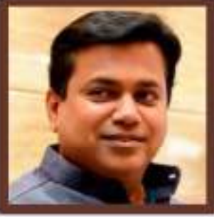
श्री. उदय सामंत मंत्री उच्च व तंत्रशिक्षण