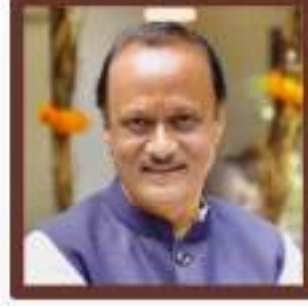
श्री. अजित पवार माननीय उप मुख्यमंत्री