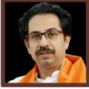
श्री. उद्धव ठाकरे माननीय मुख्यमंत्री